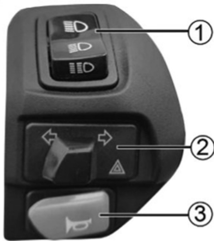
Left handlebar switch assembly

• سپس دکمه "SEAT" را فشار دهید تا زین باز شود.